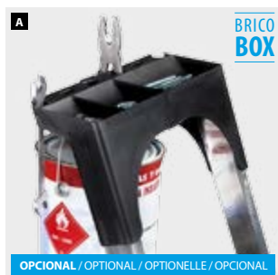
OPCIONAL / OPTIONAL / OPTIONELLE / OPCIONAL

✂ Productos suministrados en pack de 2 unidades Products supplied in pack of 2 units Produits fournis en pack de 2 unités Produtos fornecidos em embalagem de 2 unidades